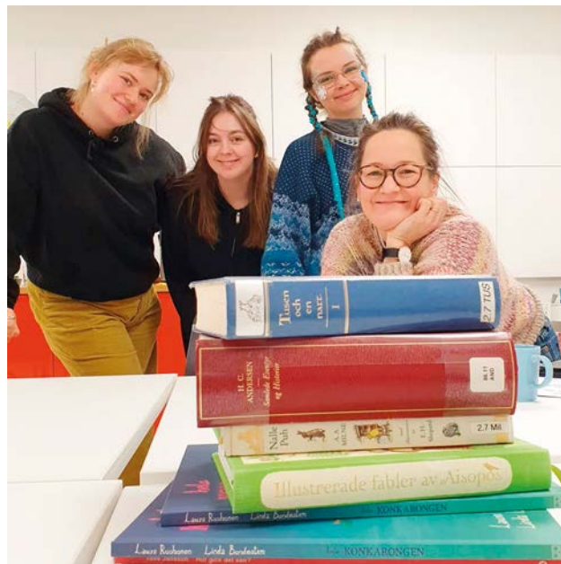
Ordkonstlärare på lärarträff i december.

Sydskustens ordkonstskola utvecklar konstant sin verksamhet med målet att stöda ordkonst som konstform, utveckla läs- och skrivfrämjande arbete och uppmuntra till nyskapande och fantasiförmåga. Till det här arbetet hör även fortsatt utveckling gällande strukturer och synlighet på nationell nivå, i Svenskfinland och internt. Under de senaste åren har ordkonstskolan aktivt