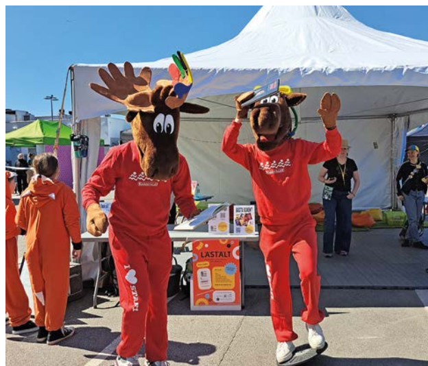
Lästält på Stafettkarnevalen i maj 2023.