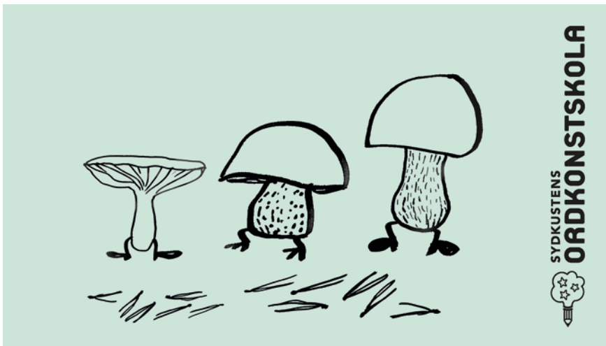
Rimjam för 1–5-åringar med temat Skogens sus.