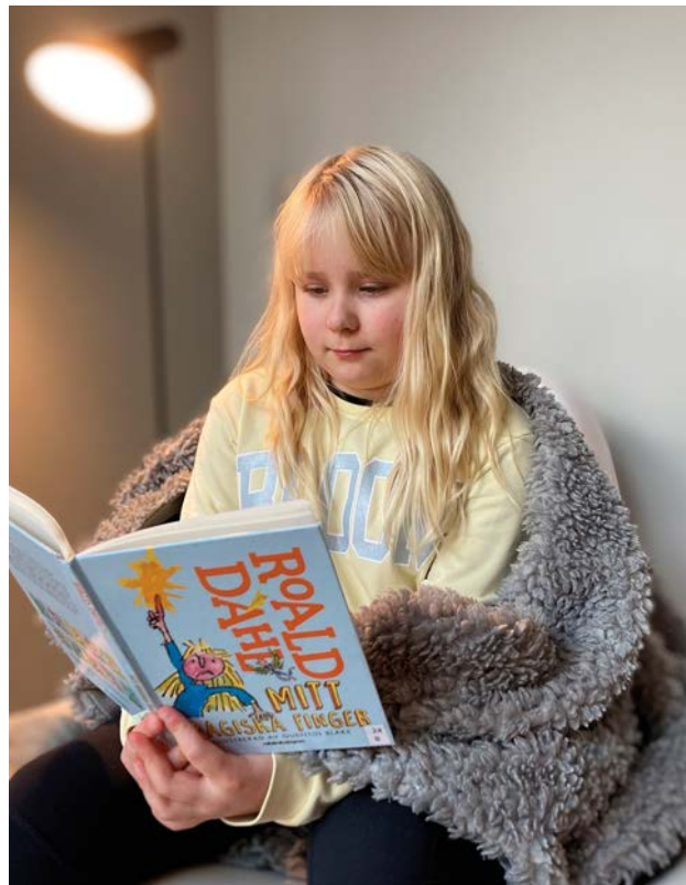
Medskapande läsning av Roald Dahls bok Mitt magiska finger.

I januari fick sammanlagt 218 femteklasser Lisi Wahls bokpaket med tio böcker och ett tillhörande inspirationsmaterial. Lärare fick också tillfälle att samlas till digitala träffar kring böckerna där paketet presenterades närmare. Böckerna nådde sammanlagt uppskattningsvis 4 000 elever och feedback samlades in i slutet av läsåret bland klasslärarna. Två böcker återkom ofta i