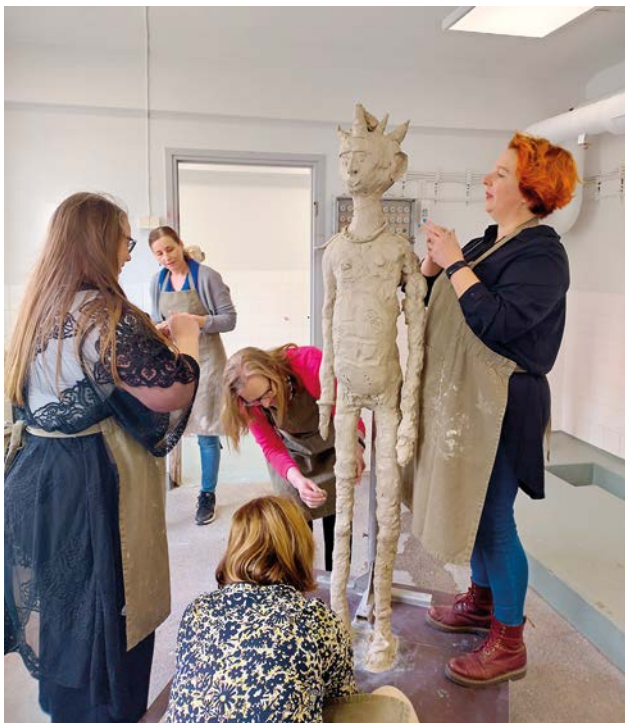
Kreativ verkstad i Sibbo maj 2023.

skolan i ett lokalt samarbete för att få det svenska innehållet under Åbo bokmässan att växa. Samarbetet inleddes redan år 2022 men utökades nu och de åtta samarbetande organisationerna hade en egen utställningsmonter samt några scenprogram i samarbetsgruppens regi. Med i samarbetet utöver Sydkusten var Luckan i Åbo, Åbo stad/Kultur, Åbo Svenska Teater, Åbo Underrättelser, Åbolands litteraturförening, Finlands Svenska Litteraturföreningar och förlaget Scriptum.