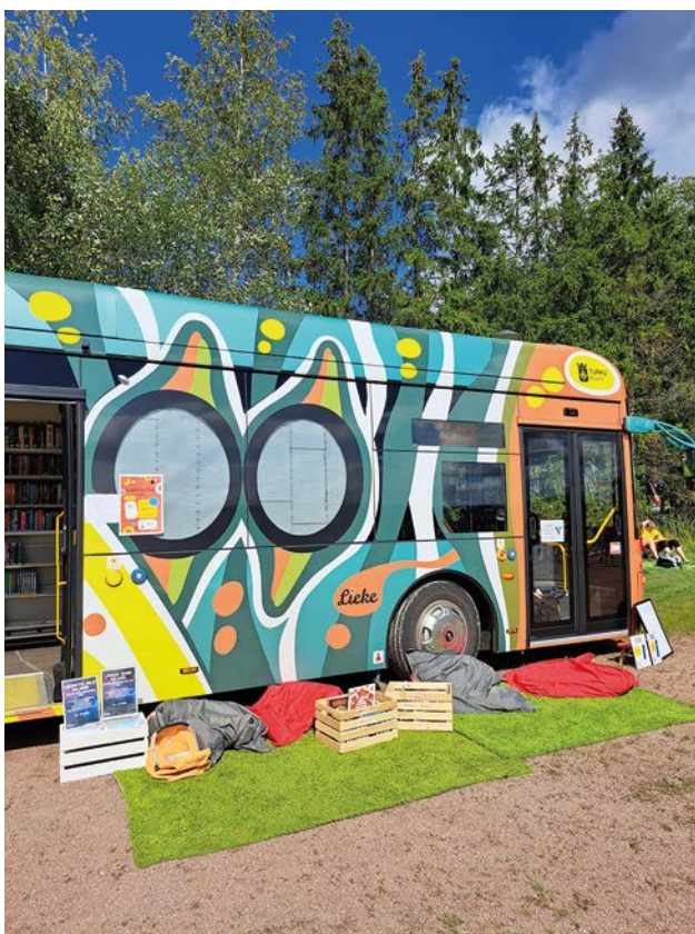
Rätt bok på rätt plats vid Gant Beach Cup i Åbo.

Under 2023 avslutades det tvååriga projektet Rätt bok på rätt plats . Projektet jobbade med att utveckla nya platser där barn, unga och familjer kunde möta böcker och få läsinspiration. I projektet vidareutvecklades två tidigare lyckade koncept: tamburbibliotek och läshörnor. Båda koncepten bygger på samarbete med lokala bibliotek och daghem respektive idrottsevenemang och