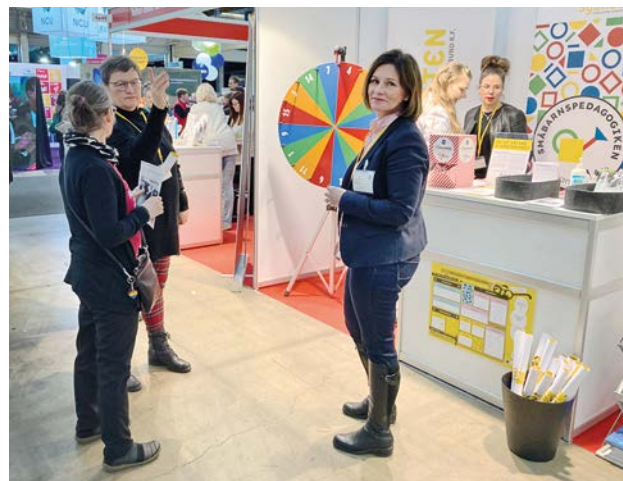
Sydkustens egen monter på Educa 2023.

Sydkusten upprätthåller ett nätverk för att diskutera aktuella utbildningsfrågor. I nätverket ingår Sydkustens medlemskommuners bildningschefer, representanter för lärarutbildningarna vid Helsingfors universitet och Åbo Akademi, Svenska kulturfonden, Kommunförbundet och Utbildningsstyrelsen. Ärenden som har lyfts upp under året var personalsituationen och rekryteringen inom småbarnspedagogik och utbildning, regeringsprogrammets implikationer för utbildning, söktrycket till utbildningarna och dubbelbehörighet inom lärarutbildningarna. Under året har två träffar arrangerats.