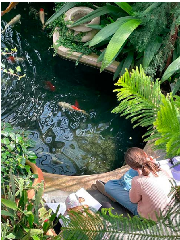
Sommarkurs i Helsingfors.

Inom de regelbundna hobbygrupperna ligger fokus på läs- och skrivglädje, inspiration och fantasi. Under år 2023 arrangerade Sydkustens ordkonstskola hobbygrupper i Esbo och Kyrklätt för sammanlagt 30 elever. Besök i skolklasser är ett sätt att implementera den nationella läskunnighetsstrategin med målet att främja läsning och skrivande bland barn, genom bland annat projektet Medskapande läsning (se nedan).