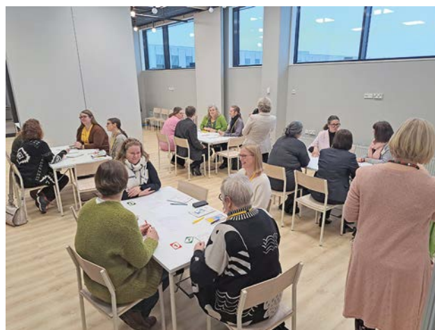
Kulturseminariet i Vanda 28.11.