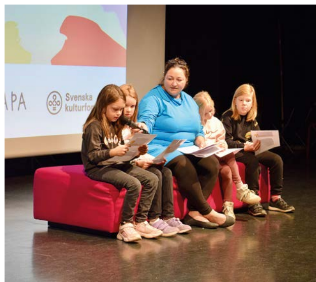
Ordkonstlever uppträdde vid Skapa-seminariet i Pargas.