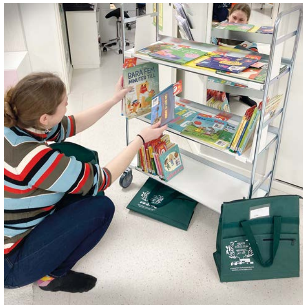
Tamburbibliotek i formen av en bokvagn.

Genom att lyfta upp läsning i nya miljöer skapades möjligheter för bibliotek att nå barn och unga i läsfrämjande syfte i samarbete med idrottsföreningar och -evenemang. Det här har gjorts genom konceptet läshörnor där projektet under 2023 deltog i fem idrottsevenemang och nådde cirka 2 500 besökare.