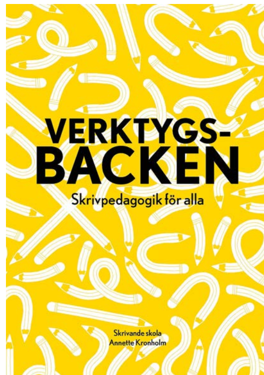
Verktygsbacken – Skrivpedagogik för alla.

starkt fokus på implementering av skrivdidaktiska utgångspunkter samt på konkreta skrivstöd till elever. Arbetet utmynnade i boken Verktygsbacken - Skrivpedagogik för alla . Under året har mycket tid gått till att sammanställa skrivpedagogiskt material och skriva teoridelen till skrivhandledningen.