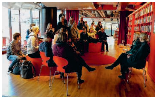
Studiebesök på biblioteket 10–13 i Stockholm.

Sydkustens ordkonstskolas representanter blev inbjudna till en nationell litteraturkonferens i Uppsala med syftet att öppna upp vår verksamhet, berätta om ordkonstundervisning och hur konstundervisningen är strukturerad i Finland. Den två dagar långa konferensen 18–19.10 handlade om litteraturen i de regionala kulturplanerna och kultursamverkansmodellen i Sverige. Arrangörer för konferensen var Länsbibliotek Sörmland, Regionbibliotek Uppsala och Biblioteksutveckling Region Örebro län.