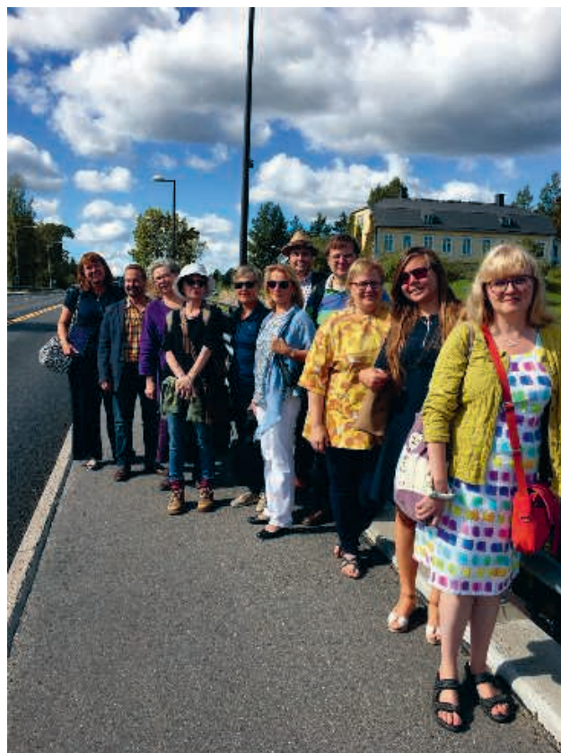
Styrelsens sommarträff i Borgå