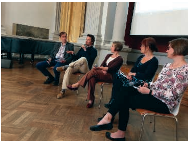
Paneldiskussion på Föreningar tillsammans slutseminarium

Förutom lokala medborgarmöten i Esbo och Vanda arrangerade man ett större sammanfattande seminarium 6 juni på G18 i Helsingfors. Mötena och slutseminariet hade som funktion att ta fram synpunkter på föreningslivet i huvudstadsregionen, att diskutera tankar om samarbete och om åtgärder för ett livskraftigt och välmående lokalsamhälle. Slutseminariet hade två syften. För det första handlade det om att delge seminariedeltagarna information om hur projektet fortlöpt och vilka resultat som man så här långt kommit till. För det andra ville vi tillföra ytterligare nya perspektiv på en social mobilisering genom att på samma sätt som i tidigare medborgarmöten föra samtal med alla inblandade. Formen för detta samtal var delvis annorlunda än på tidigare möten i och med att vi samlat en panel med olika kompetenser och perspektiv på aktivering inom lokalsamhället.