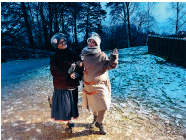
Hertonäs julstig 8 december 2018

fundera på olika frågeställningar kring deras egen läsning. Vi använde oss av servicedesignmetoder för att ta reda på vad som inspirerar till läsning och hur omgivningen påverkar intresset.