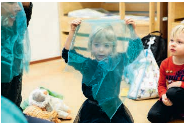
Rimcirkus i Vanda

runtom i Helsingfors under år 2018. Det är frågan om ett långvarigt programsamarbete med Helsingfors stads kultur- och fritidssektor, men i år har satsningen gjorts helt och hållet inom ordkonstskolans budget med arbetsinsatser även från biblioteket sida. De mest välbesökta tillfällena var på Malms kulturhus under svenska veckan 10.11.2018 och på Centrumbiblioteket Odes festliga invigning 6.12.2018. Rimjam ordnades år 2018 även på beställning i Nagu, Åbo och Vanda med familjer och daghemsgrupper som målgrupp.