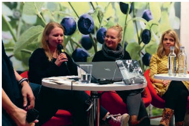
Panelstaltal: Läs till mig som liten är 26.10.2018.