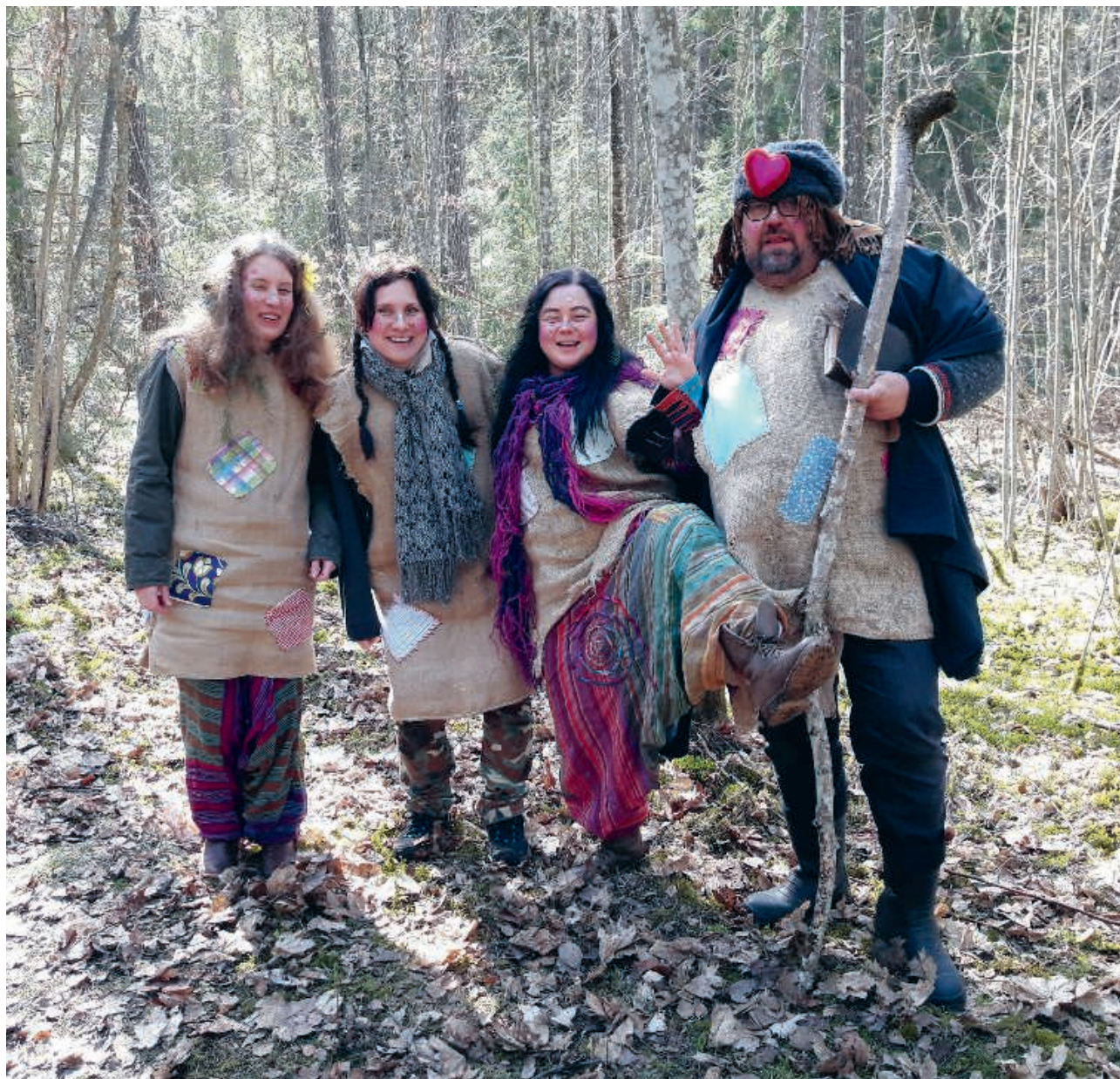
Trollskog – VårKultur 2018