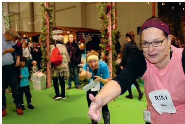
Rimjam: Rusa kuta spring 27.10.2018.

Syd kustens ordkonstskola höll en verkstad med unga i åk 9 i Mattlidens skola i Esbo 23.5.2018. Verkstaden gjordes som en pilot inom ramen för projektet Läsrörelsen som det nationella läskunnighetsforumet hade initierat. Forumet har som uppgift att utveckla barns och ungas läskunnighet och läsintresse. I Mattliden träffade vi dryga 20 elever som tillsammans fick diskutera och